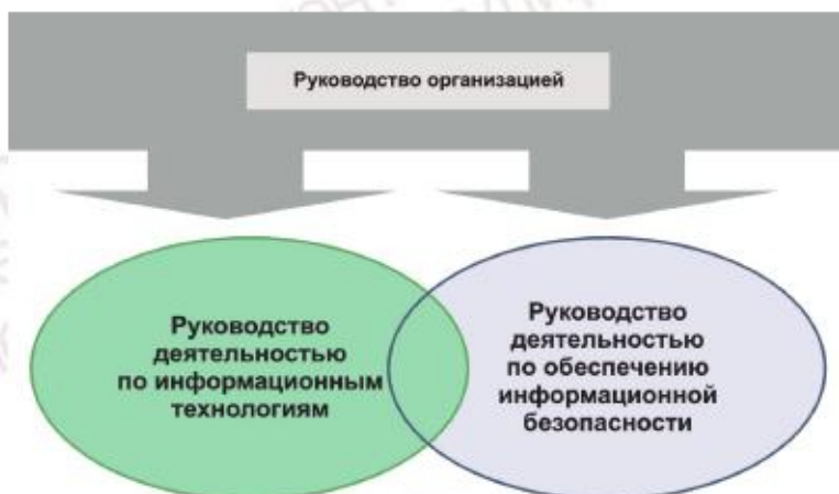
Рисунок А.1 — Связь руководства деятельностью по обеспечению ИБ с руководством деятельностью по ИТ

Взаимосвязь между руководством деятельностью по обеспечению ИБ и руководством деятельностью по ИТ показана на рисунке А.1.