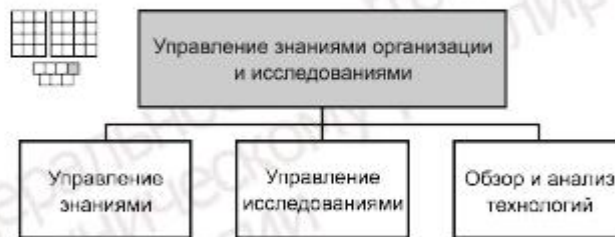
Рисунок 3 — Декомпозиция группы процессов «Управление знаниями организации и исследованиями» на элементы процессов уровня 2

6.2 Процессы группы 1.3.4 предназначены для управления знаниями, которыми располагает организация, для управления исследованиями новых технологий электросвязи и определения целесообразности их применения в организации, для планирования инвестиций и назначения приоритетов выполнения НИОКР (научно-исследовательских и опытно-конструкторских работ), обеспечивающих внедрение новых технологий.