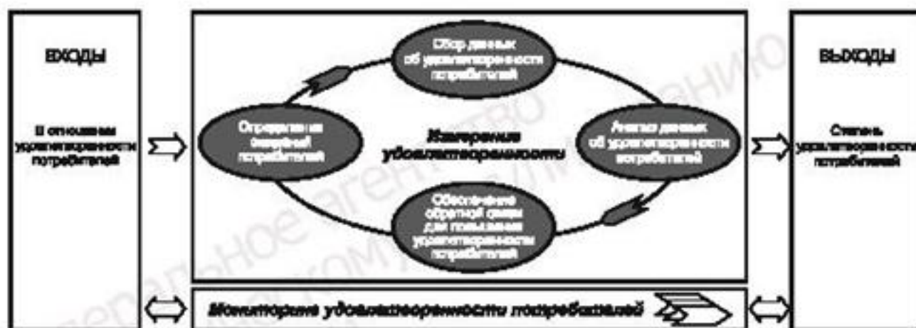
Рисунок 1 — Мониторинг и измерение удовлетворенности потребителей