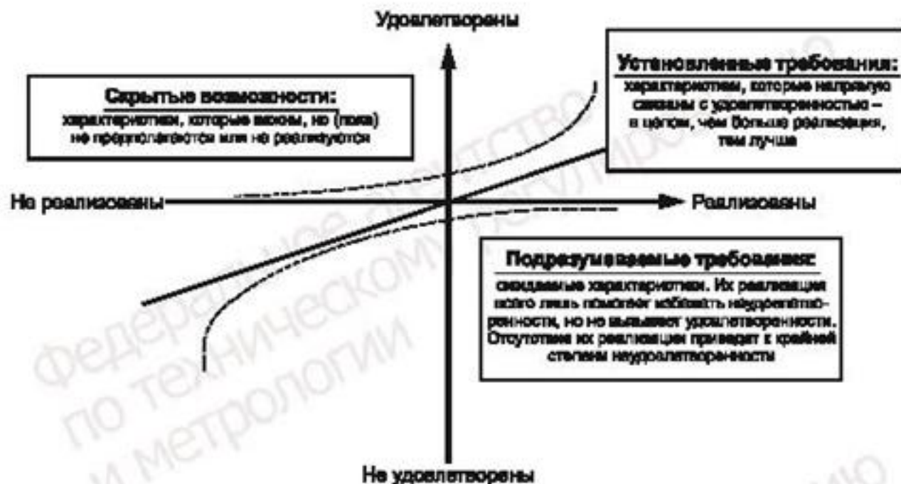
Рисунок В.1 — Взаимосвязь между различными характеристиками и удовлетворенностью потребителей

Характеристики инфраструктуры — это характеристики продукции, которые не влияют на удовлетворенность потребителей, но необходимы для функционирования предприятия или эксплуатации продукции.