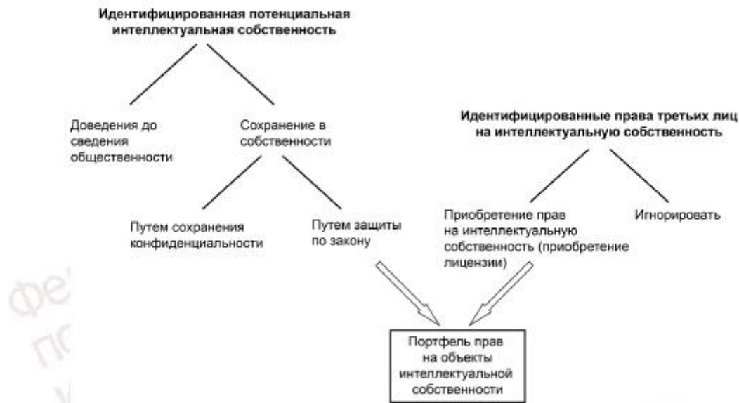
Рисунок 1 — Дерево решений в части интеллектуальной собственности

Управление портфелем прав на объекты интеллектуальной собственности должно удовлетворять требованиям заказчика, соответствовать конкретной сфере товарного производства, а также уровню совместных действий и уровню охраны/защиты, установленному для конкретной территории (см. 6.4).