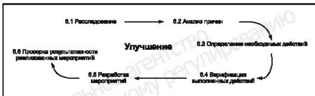
Рисунок 3 — Этап III. Улучшение

Практика показывает, что документально план должен быть разработан до начала проведения расследования (см. приложение D). План должен включать: