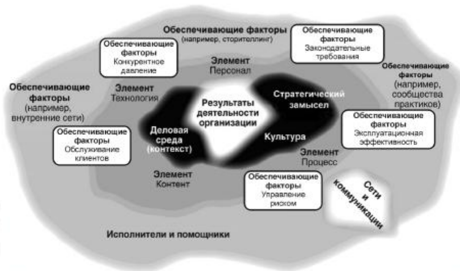
Рисунок 2 — Экосистема знаний