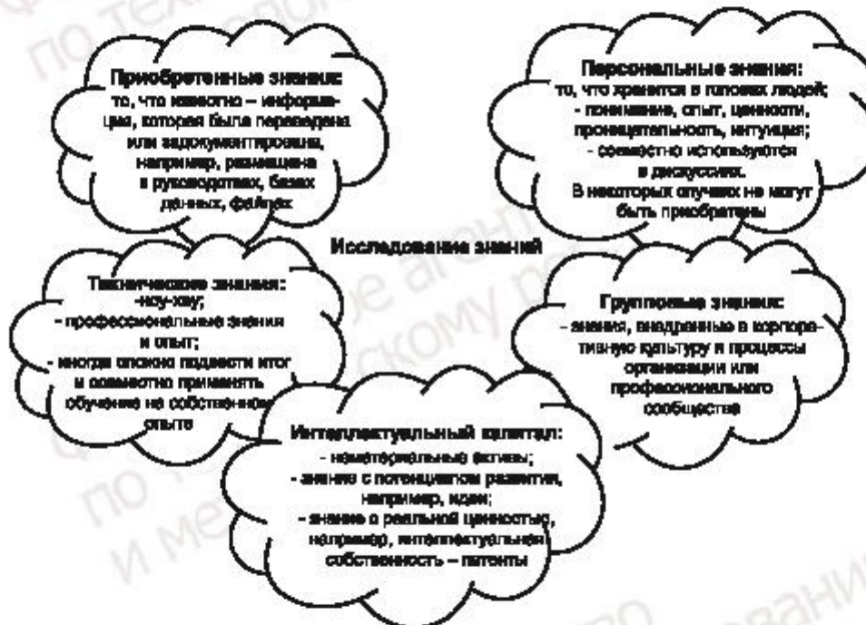
Рисунок 1 — Типы знаний

На рисунке 1 показан возможный способ описания различных типов знаний.