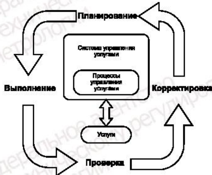
Рисунок 2 — Применение методологии PDCA в управлении услугами

Подход к совершенствованию, изложенный в ИСО/МЭК 20000-1:2011, основан на методологии PDCA. На рисунке 2 показано, каким образом можно применять методологию PDCA к СУУ, в том числе к процессам управления услугами, описанным в ИСО/МЭК 20000-1:2011 (разделы 5 и 9), и к самим услугам. Каждый элемент методологии PDCA зависит от предыдущего элемента и обязателен для успешного внедрения СУУ.