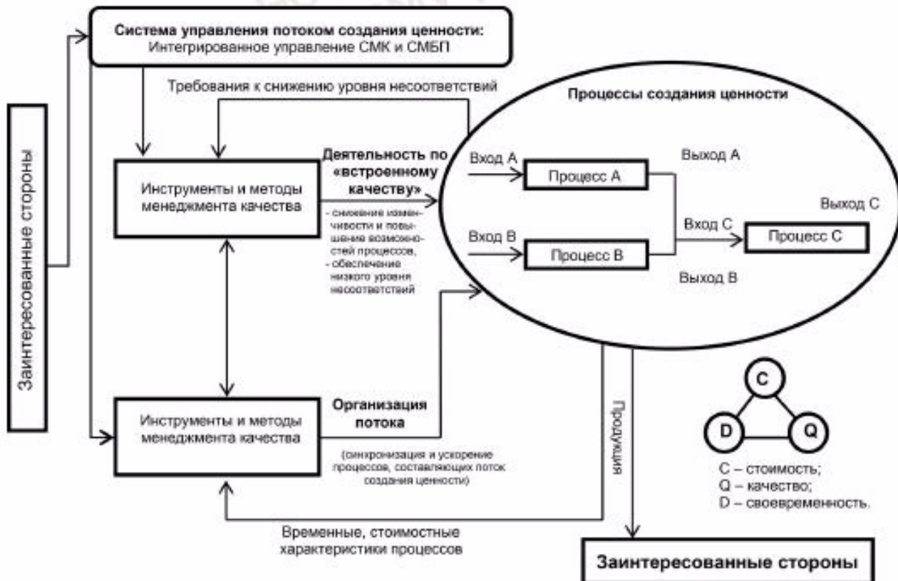
Рисунок 3 — Модель интеграции СМК и СМБП для управления потоком создания ценности

На уровне системы менеджмента интеграция СМК и СМБП осуществляется через создание единой системы управления выходными характеристиками ПСЦ, обеспечивающей планирование, реализацию, контроль и улучшение ПСЦ (продукции и/или услуг) с необходимыми характеристиками качества, стоимости и времени потока продукции в соответствии с требованиями потребителей и других заинтересованных сторон организации (см. рисунок 3).