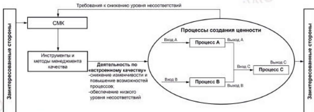
Рисунок 1 — Применение менеджмента качества при производстве продукции/оказании услуг

ствующей продукцией не останавливали и не замедляли процессы, составляющие поток создания ценности (см. рисунок 1).