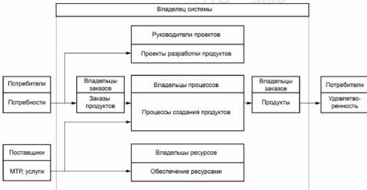
Рисунок 4 — Схема выполнения внешнего заказа в организации

5.8.1 Обобщенная схема выполнения внешнего заказа в организации и связанная с ним ответственность представлены на рисунке 4.