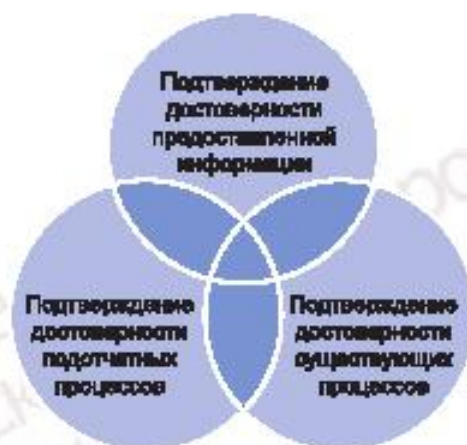
Рисунок 1 — Компоненты достоверности экологической информации

Настоящий стандарт предназначен для поддержания отчетности об экологической результативности организации и не устанавливает никаких требований к структурным элементам (объектам и процессам) организации, задействованным в процессе подготовки и предоставления отчетности. Настоящий стандарт также предназначен для его использования организациями, заинтересованными в подтверждении достоверности экологической информации, что даст им уверенность в достоверности экологических отчетов для: