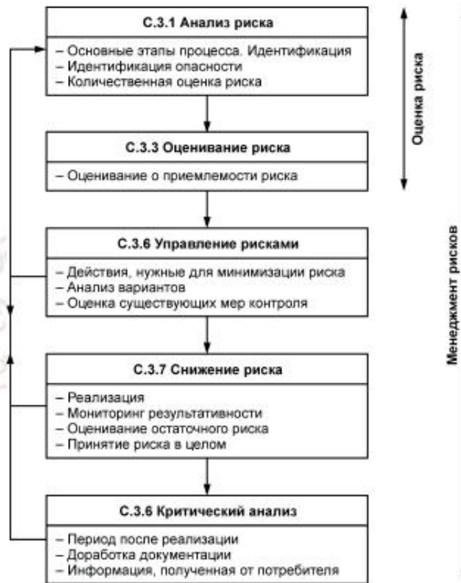
Рисунок С.1 — Схематическое представление процесса менеджмента рисков