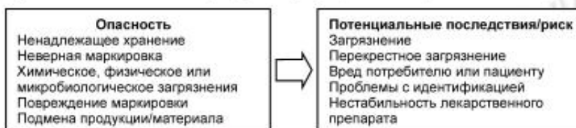
Рисунок С.2 — Примеры рисков и потенциальных последствий

В отношении каждой опасности, по которой отсутствуют меры контроля, должны оцениваться последствия и вероятность возникновения (получая информацию от потребителей по мере необходимости).