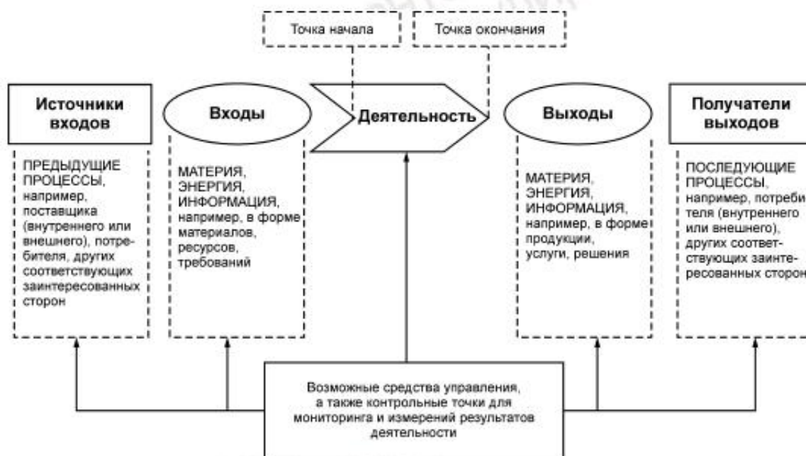
Рисунок 1 — Схематичное изображение элементов процесса

Рисунок 1 дает схематичное изображение любого процесса и иллюстрирует взаимосвязь элементов процесса. Контрольные точки мониторинга и измерения, необходимые для управления, являются специфическими для каждого процесса и будут варьироваться в зависимости от соответствующих рисков.