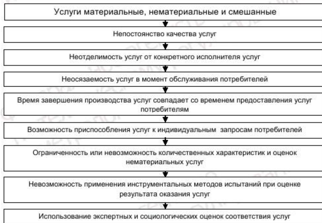
Рисунок 2 — Специфические особенности услуг

В связи с тем, что услугам присущи некоторые специфические особенности (см. рисунок 2), система менеджмента качества услуг отличается от системы менеджмента качества продукции.