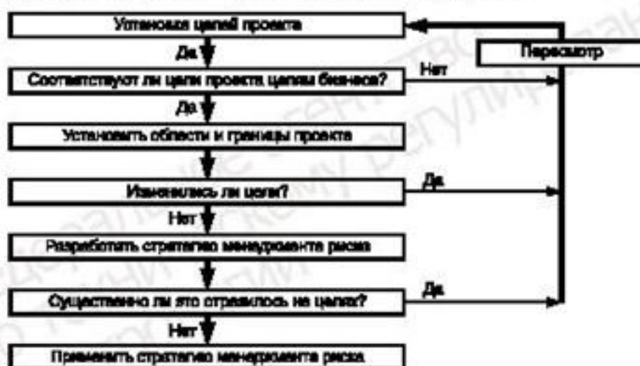
Рисунок 2 — Этапы менеджмента рисков на уровне предприятия (бизнеса)

Для повышения эффективности менеджмента рисков при выполнении проектов для целей коммерческой деятельности в рамках предприятия представляется целесообразным при принятии решений рассматривать коммерческие аспекты деятельности предприятия на различных структурных уровнях. С этой целью при принятии решений на любом уровне необходимо учитывать риски, возникающие в результате принятия несоответствующих решений на более высоких и более низких уровнях. Этапы менеджмента риска на уровне предприятия 1) (бизнес—процесса) приведены на рисунке 2.