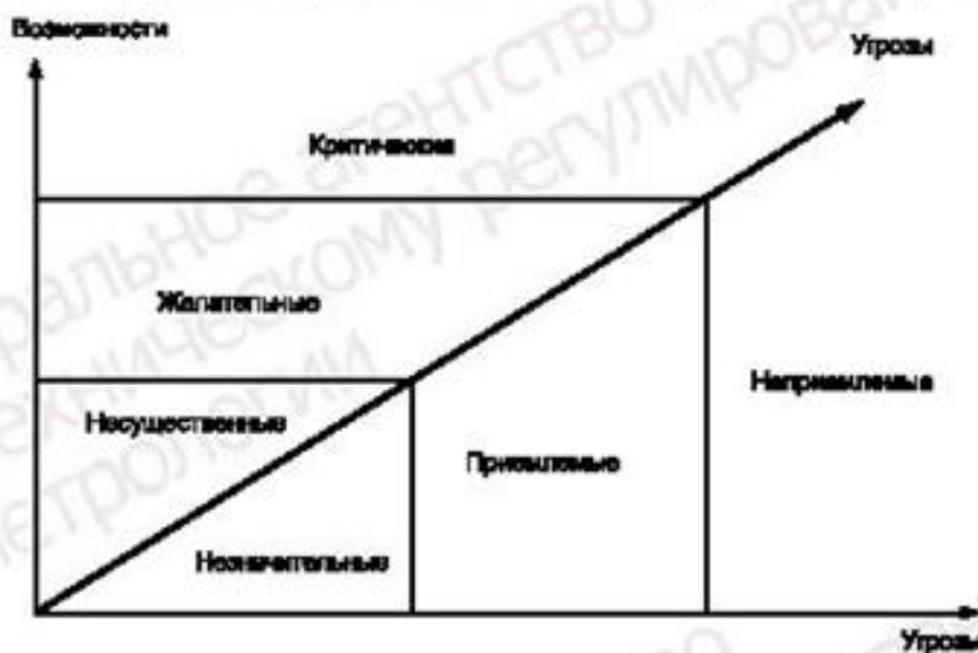
Рисунок 4 — Соответствие между угрозами и возможностями

Соответствие между угрозами и требуемыми возможностями приведено на рисунке 4.