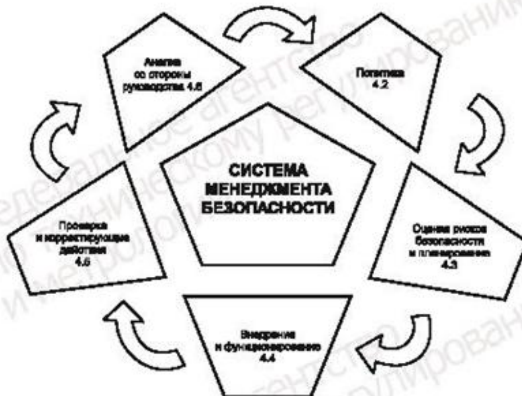
Рисунок 2 — Элементы системы менеджмента безопасности