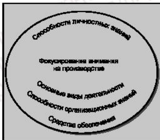
Рисунок 1 — Основа менеджмента знаний: европейская перспектива

2 Пять основных видов деятельности в отношении знаний были идентифицированы как наиболее широко применяемые: идентификация, создание, хранение, обмен знаниями и их применение. Они представляют собой второй компонент основы посредством формирования единого процесса.