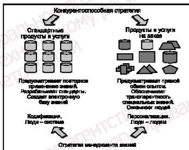
Рисунок 3 — Две общие стратегии МЗ

Эмпирические данные предполагают, что организации начинают работу по внедрению первой инициативы по МЗ в основном в тех областях, которые они рассматривают как свою основную компетентность, таких как маркетинг и продажи, исследования и разработки или производство. В связи с этим возможным подход может начинаться с выбора производственной области или процессов, которые должны поддерживаться МЗ, как это представлено на рисунке 4.