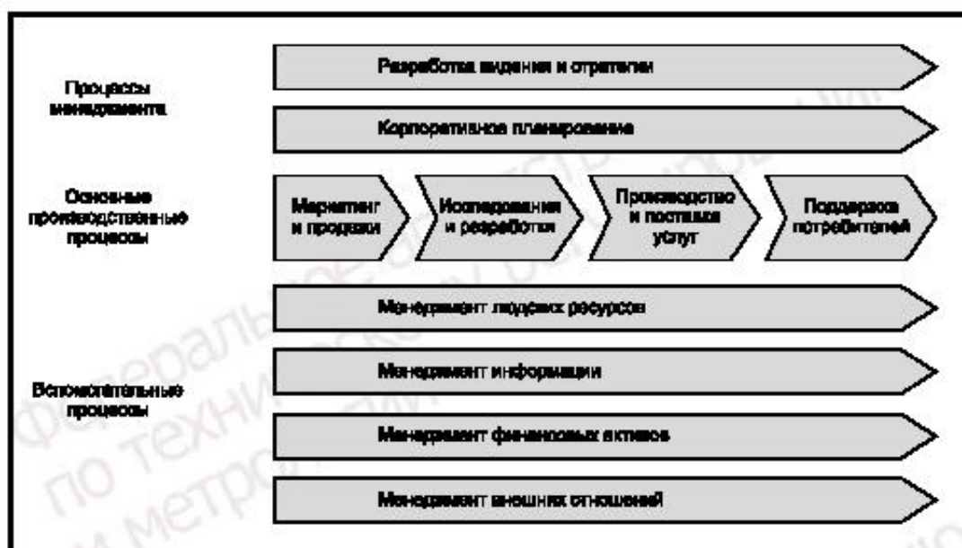
Рисунок 4 — Пример организационной карты процесса

Если организация нацелена на постоянную инновацию своего продукта, в этом случае инициатива по МЗ может улучшить менеджмент знания, необходимый для разработок, создать сетевые отношения с внешними исследовательскими подразделениями в университетах, и организации могут пригласить на работу брокера по знаниям для постоянного поиска самых последних инноваций и патентов в рамках производственной области.