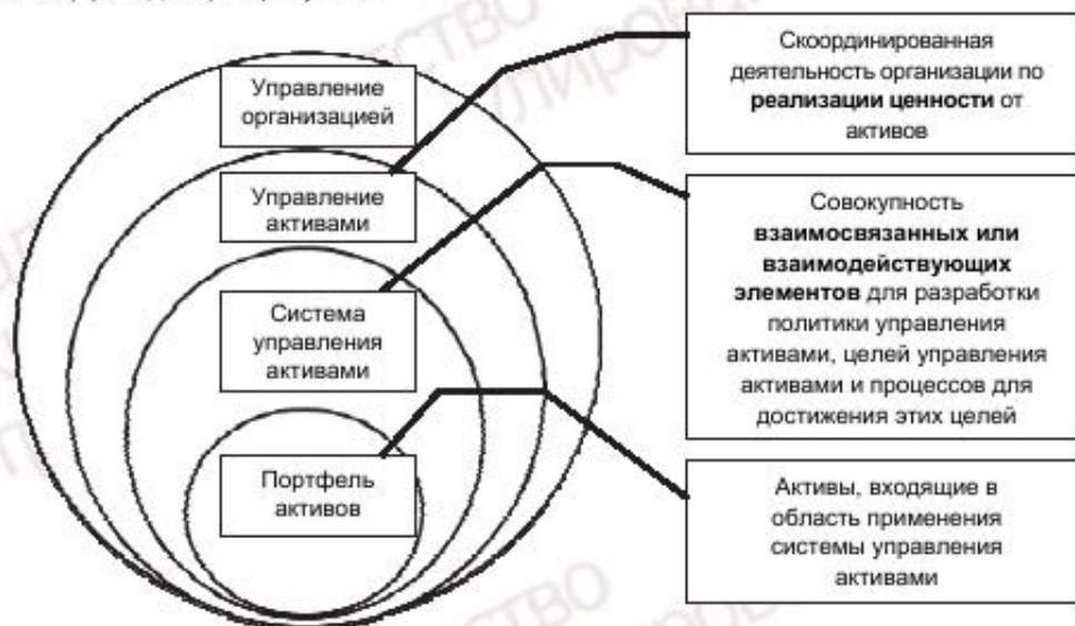
Рисунок 1 — Взаимоотношение между ключевыми терминами

деятельность по управлению активами может быть формализована посредством системы управления активами. Например, такие аспекты, как руководство, культура, мотивация, поведение, которые могут оказывать значительное влияние на достижение целей управления активами, могут управляться организацией вне системы управления активами. Взаимосвязь между ключевыми терминами управления активами (приведена) на рисунке 1.