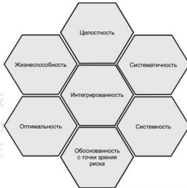
Рисунок 1 — Основные принципы и характеристики менеджмента активов