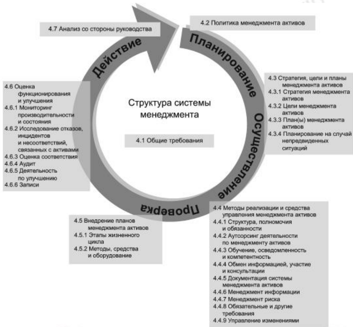
Рисунок 6 — Структура системы менеджмента активов

Федеральное агентство по техническому регулированию и метрологии