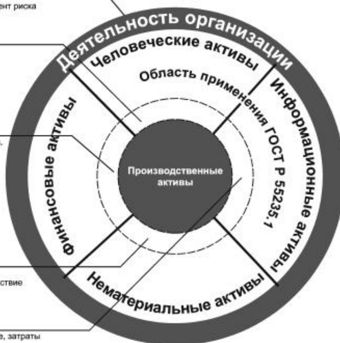
Рисунок 2 — Область применения стандартов ГОСТ Р серии 55235 относительно других видов активов и взаимосвязь с ними

Важные факторы: состояние, производительность, применение, затраты и возможности