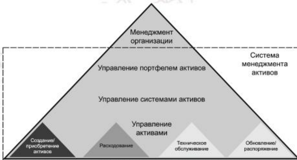
Рисунок 3 — Уровни управления активами в системе менеджмента активов

Исследование устойчивости системы активов является одним из способов оптимизации процесса принятия решений. Крупные организации могут иметь диверсифицированный портфель систем активов, который содействует достижению целей организации и обеспечивает широкий диапазон инвестиционных возможностей, вариантов производительности и видов риска. Для реализации скоординированного и оптимизированного подхода к диверсификации и комплексности активов в соответствии с целями, приоритетами и выбранным профилем риска организации важную роль играет интегрированная система менеджмента активов.