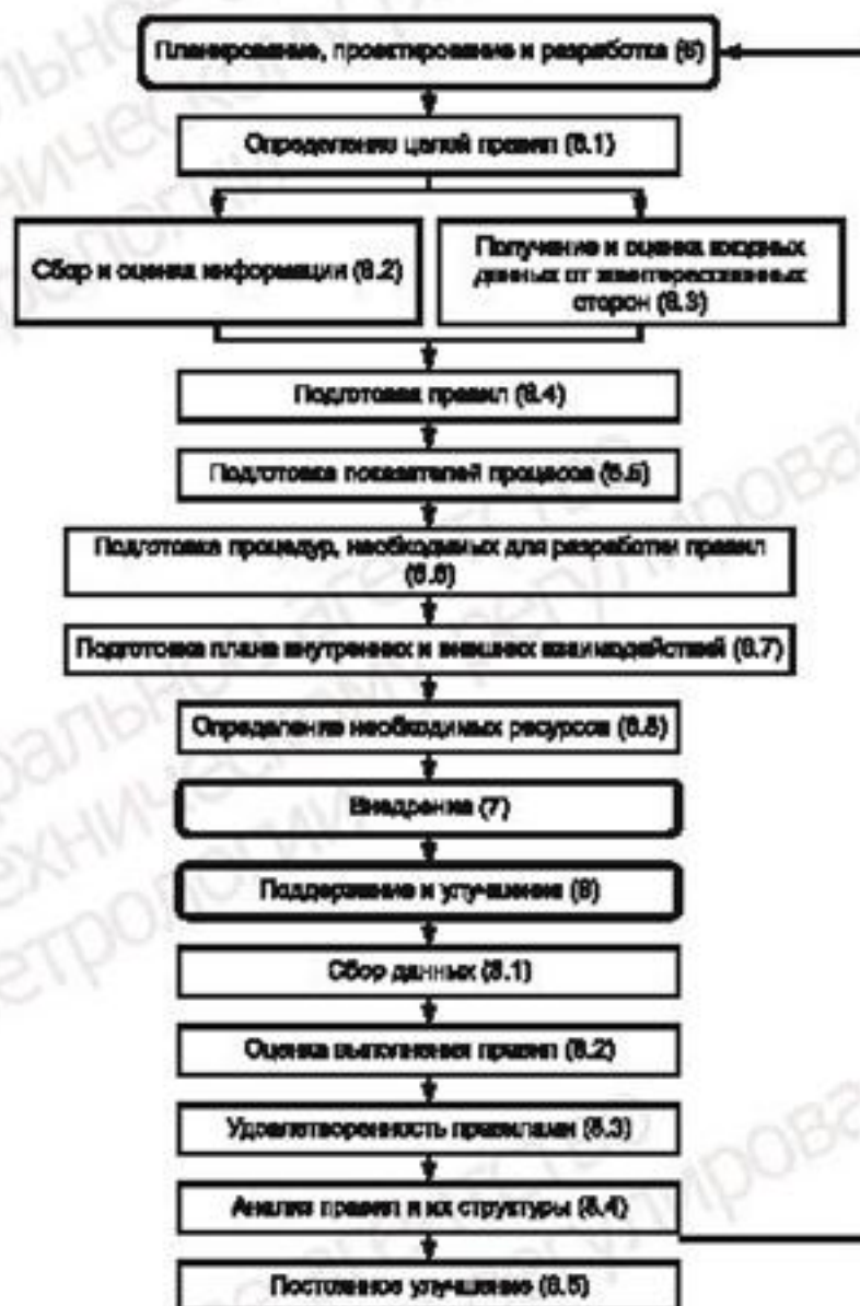
Рисунок F.1 — Структура правил

На рисунке F.1 представлена организационная структура принятия решений и действий по планированию, проектированию, разработке, внедрению, поддержанию и улучшению правил.