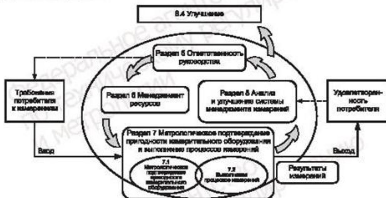
Рисунок 1 — Модель системы менеджмента измерений

Одним из установленных принципов менеджмента качества в ИСО серии 9000 является процессный подход. В системе менеджмента измерений процессы измерений следует рассматривать как специальные процессы, направленные на обеспечение требуемого качества продукции, выпускаемой организацией. Модель системы менеджмента измерений, соответствующая настоящему стандарту, представлена на рисунке 1.