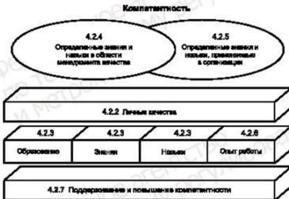
Рисунок 1 — Концепция компетентности консультанта по системам менеджмента качества

Примечание — Термин «компетентность» определен в ИСО 9000 как выраженная способность применять свои знания и умение.