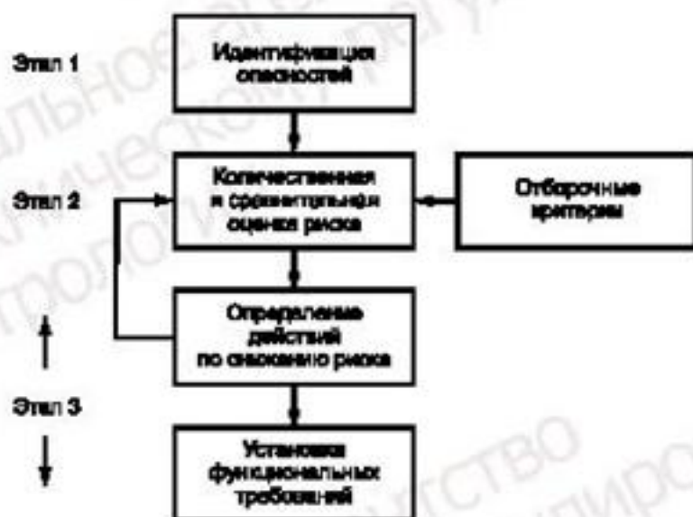
Рисунок 2 — Схема процесса менеджмента риска

Процесс идентификации опасностей, оценки риска и управления риском схематично показан на рисунке 2, который также иллюстрирует три этапа, описанных в разделе 3.