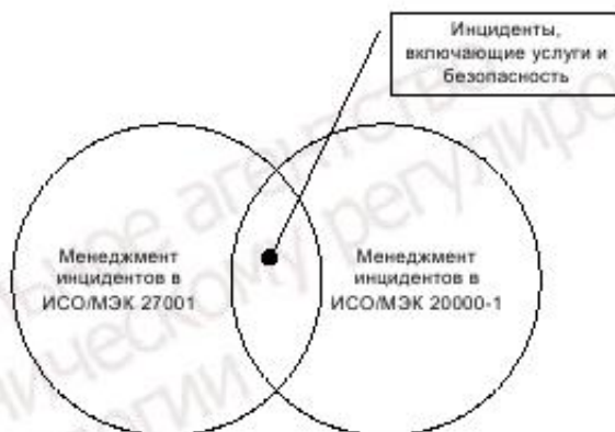
Рисунок 3 — Иллюстрация взаимосвязи между стандартами, касающаяся менеджмента инцидентов

На рисунке 3 показана взаимосвязь между менеджментом инцидентов информационной безопасности в ИСО/МЭК 27001 и менеджментом инцидентов в ИСО/МЭК 20000-1.