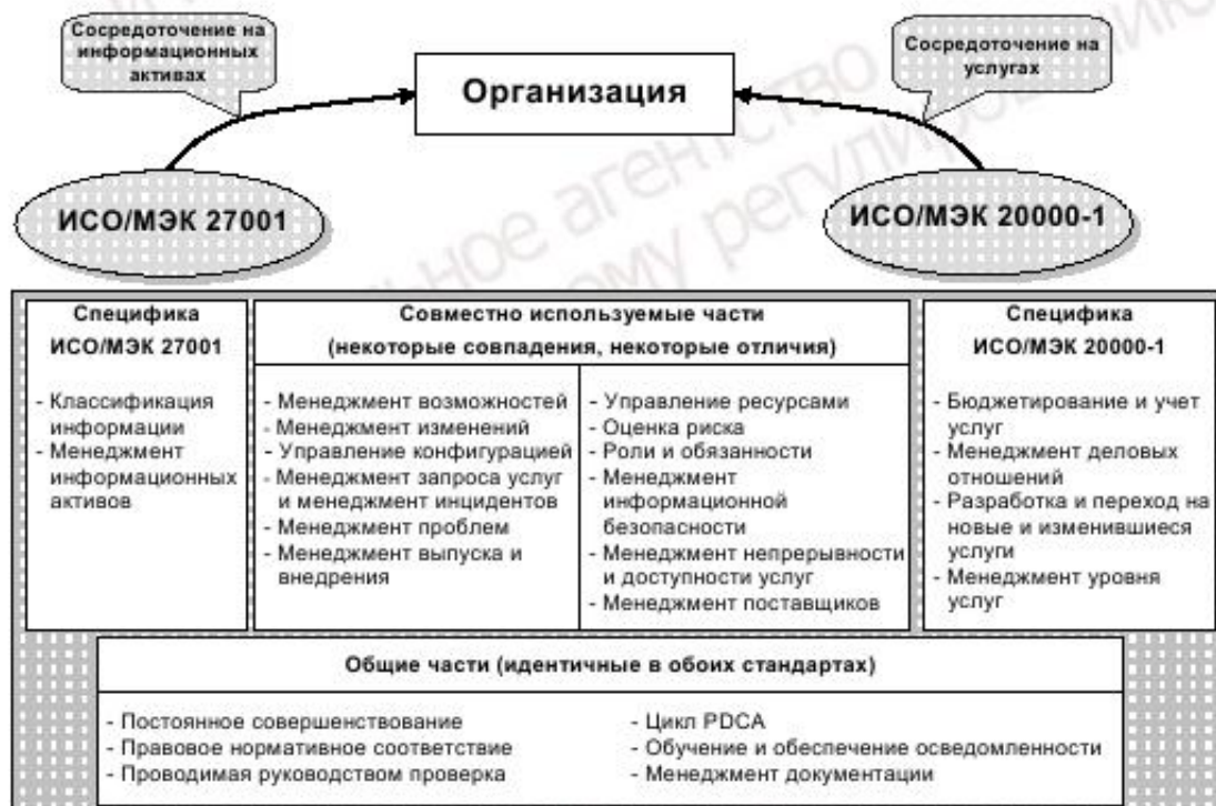
Рисунок 1 — Сравнение концепций ИСО/МЭК 27001 и ИСО/МЭК 20000-1

Менеджмент услуг и менеджмент информационной безопасности часто рассматривают так, будто они не связаны и даже не зависят один от другого. Условием такого разделения является то, что менеджмент услуг, бесспорно, может иметь отношение к эффективности и рентабельности, тогда как менеджмент информационной безопасности часто не рассматривается как основа для эффективного оказания услуг. В результате менеджмент услуг часто реализуется в первую очередь. Однако, как показано на рисунке 1, многие цели управления, а также меры и средства контроля и управления из приложения А ИСО/МЭК 27001:2005, также включены в требования менеджмента услуг из ИСО/МЭК 20000-1.