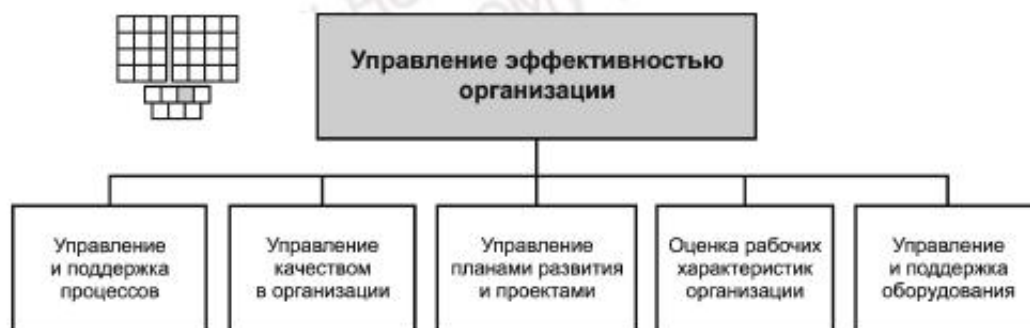
Рисунок 3 — Декомпозиция группы процессов «Управление эффективностью организации» на элементы процессов уровня 2

6.2 Процессы группы 1.3.3 предназначены для управления деятельностью организации с целью обеспечения рационального и эффективного выполнения производственных процессов.