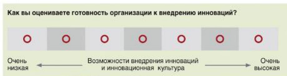
Рисунок 2 — Пример одного из контрольных вопросов