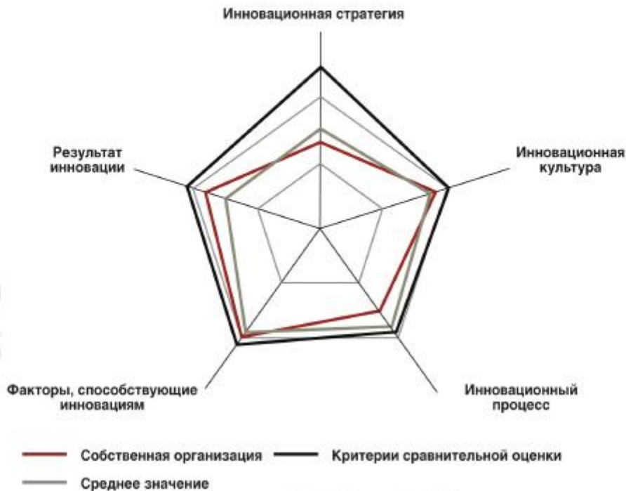
Рисунок 4 — Пример оценки результатов бенчмаркинга системы инновационного менеджмента