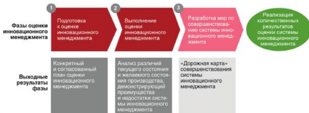
Рисунок 5 — Фазы оценки инновационного менеджмента

Каждая фаза должна четко определять требования к конечным результатам, срокам и графикам работ, а также необходимым ресурсам. Все три указанные фазы должны дополняться ожидаемыми количественными результатами. Они могут использоваться при формировании общего понимания сотрудников и при проведении обучения в части инновационного менеджмента, а также в части повышения конкурентоспособности предприятия и сети создания ценностей.