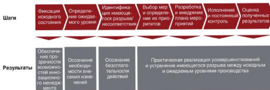
Рисунок 1 — Последовательность принятия решений в ходе процедуры оценки инновационного менеджмента

Оценка функционирования системы инновационного менеджмента предприятия может быть проведена в любой момент времени существования предприятия. На рисунке 1 приведена последовательность этапов и точек принятия решения по оценке инновационного менеджмента.