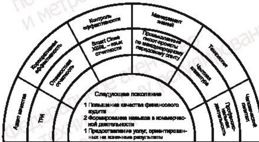
Рисунок 3 — Следующее поколение структуры