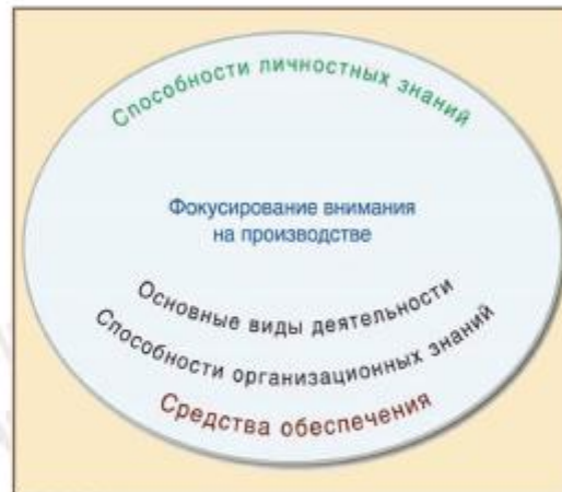
Основа менеджмента знаний: европейская перспектива

1 Фокусирование внимания на производственной деятельности должно быть центром любой инициативы в области МЗ и представлять собой дополнительную значимость организации, и может, как правило, включать разработку стратегии, инновацию продукта (услуги) и разработку, производство и доставку услуги, поддержку реализации продукции и потребителей. Эти процессы представляют собой внутренний организационный контекст, в котором создается и применяется знание о продуктах и услугах, потребителях или технологии.