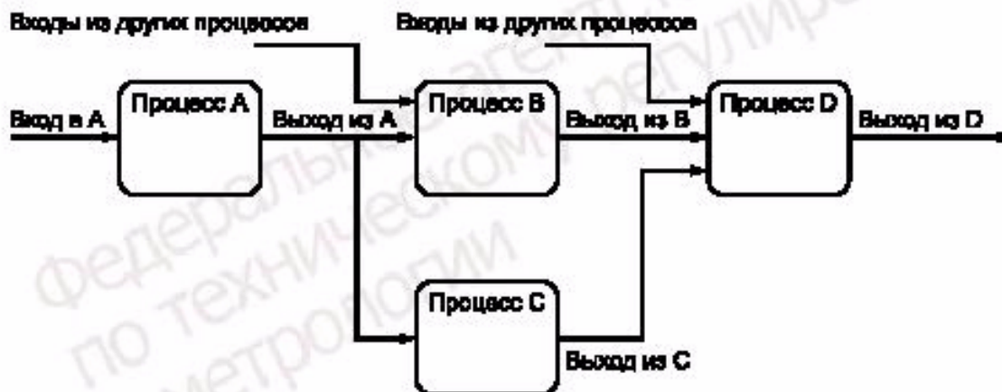
Рисунок А.1 — Процесс, преобразующий входы в выходные результаты

Для эффективного функционирования организационные процессы определяют и управляют многочисленными связанными действиями. Действия или совокупность действий, использующих ресурсы и входы, которые могут быть преобразованы в выходные результаты, можно рассматривать как процесс. Как правило, результат одного процесса формирует вход к следующему процессу, как приведено на рисунке А.1.