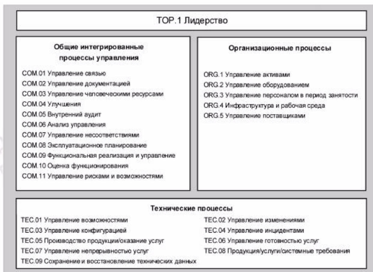
Рисунок 2 — Процессы в ЭМП