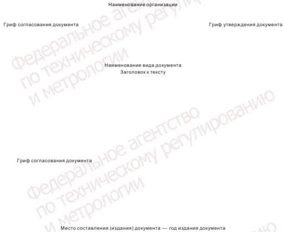
Рисунок А.1 — Расположение реквизитов на титульном листе документа