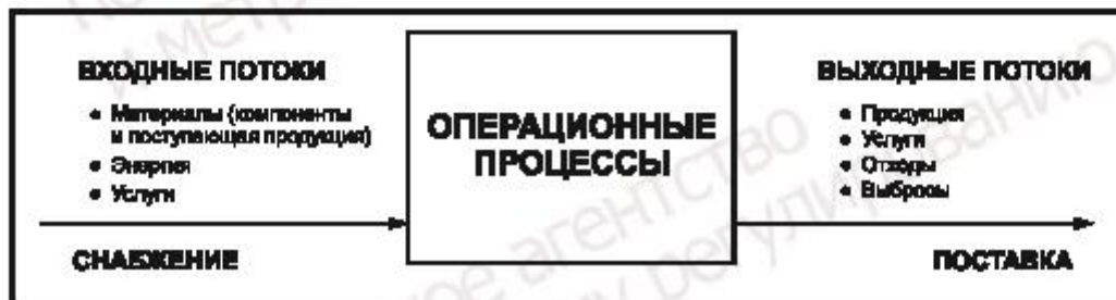
Рисунок 3 — Операционные процессы организации (общая схема)

Показатели эффективности операционной деятельности (ПЭОД) обеспечивают предоставление руководству информации об экологической эффективности производственной деятельности организации. ПЭД можно идентифицировать по перечню входных потоков организации, ее рабочих процессов и оборудования, и выходных потоков, как показано на рисунке 3.