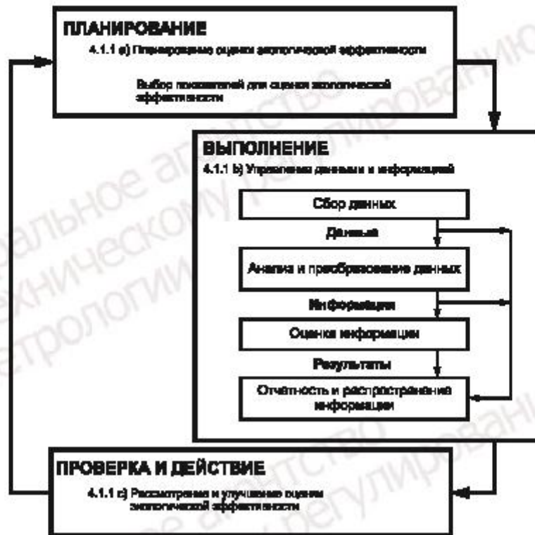
Рисунок 2 — Схема ОЭЭ (согласно модели PDCA)