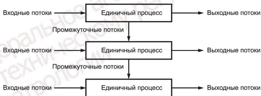
Рисунок 3 — Пример совокупности единичных процессов в рамках производственной системы