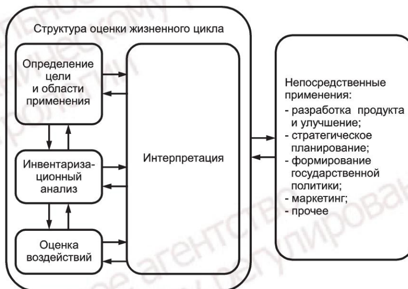
Рисунок 1 — Стадии ОЖЦ

4.2.3 Результаты ОЖЦ могут являться полезными входными данными для процессов принятия решений. Непосредственные применения результатов ОЖЦ или применения ИАЖЦ, то есть применения, предусмотренные в определении цели и области применения ОЖЦ или исследований ИАЖЦ приведены на рисунке 1. Дополнительная информация по областям применения ОЖЦ приведена в приложении А.