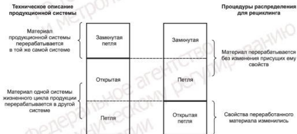
Рисунок 2 — Отличие между техническим описанием производственной системы и процедурами распределения для рециклинга