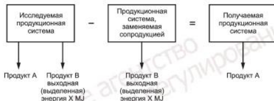
Рисунок D.1 — Пример предотвращения разделения входных/выходных потоков или производственной системы путем расширения ее границ

Примечание 2 — На рисунке D.1 приведен способ предотвращения распределения, если исследуемая производственная система содержит два продукта: продукт А (исследуемая производственная система) и продукт В (в данном случае это энергетический продукт).