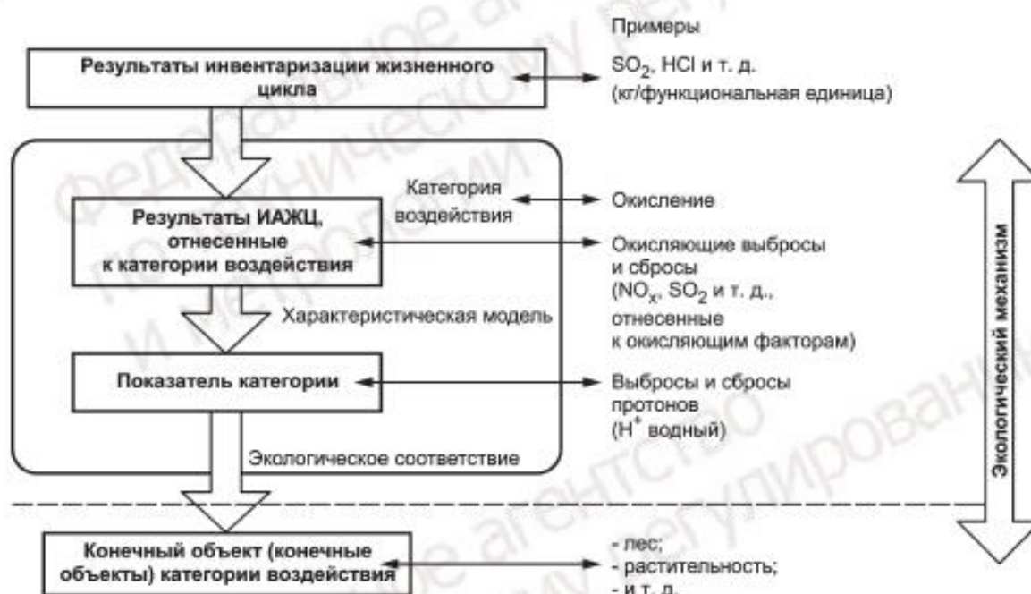
Рисунок 3 — Концепция показателей категории

Экологическое соответствие подразумевает качественную оценку степени связи между определенным показателем категории и конечными объектами категории воздействия; например, сильная, умеренная или слабая связь.