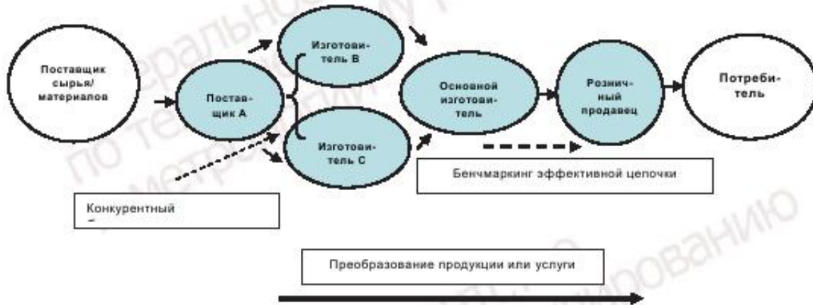
Рисунок 1 — Цикл цепочки поставок

Целью методологии бенчмаркинга является сопоставление этих уровней по всей цепочке поставок снизу доверху или сверху донизу (бенчмаркинг эффективности цепочки поставок) или звеньями одного уровня (конкурентный бенчмаркинг).