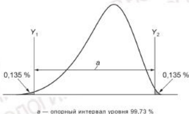
Рисунок 4 — Ненормальное распределение

Если распределение значений характеристики не является нормальным или является искаженным нормальным, то опорный интервал может иметь вид, представленный на рисунке 4. Значения Y_1 и Y_2 , обычно представляющие собой квантили уровней 0,135 % и 99,865 %, могут быть оценены с использованием вероятностной бумаги (см. рисунок 5 в качестве примера использования вероятностной бумаги для выявления экстремальных значений) или при помощи соответствующего программного обеспечения. Значения могут быть вычислены с использованием таблиц (см. приложение В) или частной функции вероятностей, как предложено в приложении С.