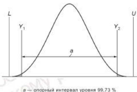
Рисунок 3 — Нормальное распределение с границами поля допуска