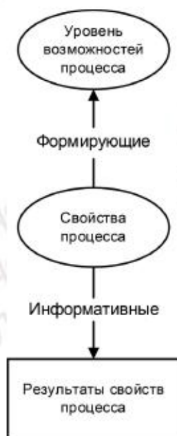
Рисунок А.1 — Формирующие и информативные измерения возможностей процесса

Уровень возможностей процесса характеризуется одним или более свойствами, которые представляют собой формирующие измерения возможностей процесса. Свойства процесса необходимы для конструирования возможностей процесса. Свойства процесса демонстрируются путем соответствия результатам свойства процесса, представляющим собой информативные измерения.