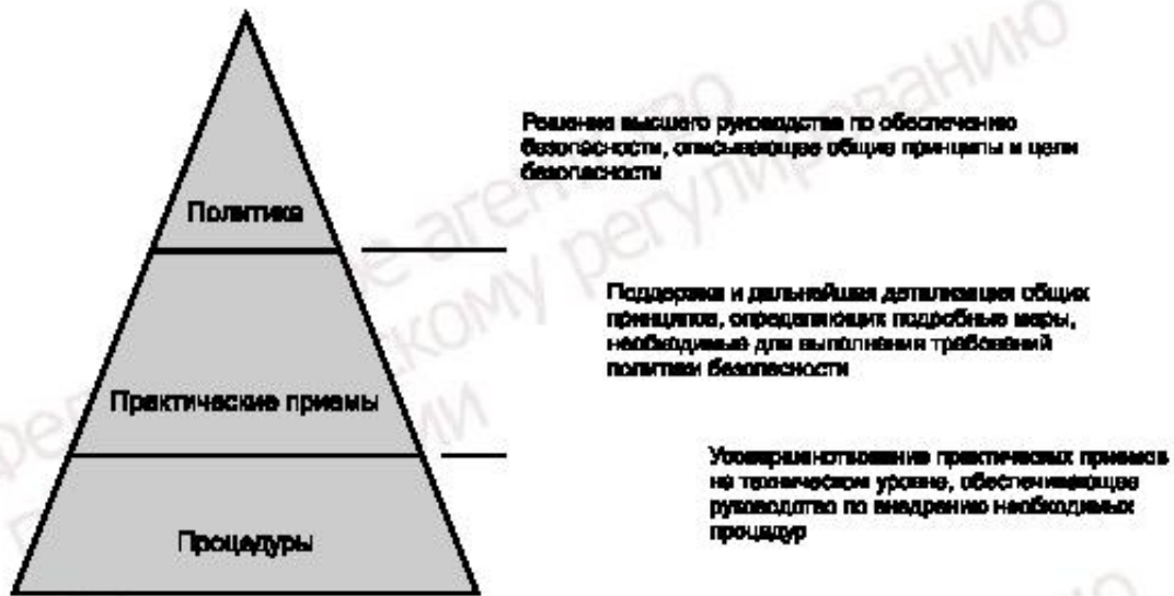
Рисунок 1 — Документация программы

В документах, относящихся к информационной безопасности, должны быть охвачены как высокоуровневые цели организации, так и конкретные, относящиеся к безопасности, настройке устройств, реализующих политику. Диапазон охвата целей лучше всего представить множественными уровнями документации. Число уровней должно быть сведено к минимуму, и настоящий стандарт рекомендует использование трех уровней: документация о политике, документация практических приемов обеспечения безопасности и документация операционных эксплуатационных процедур безопасности.