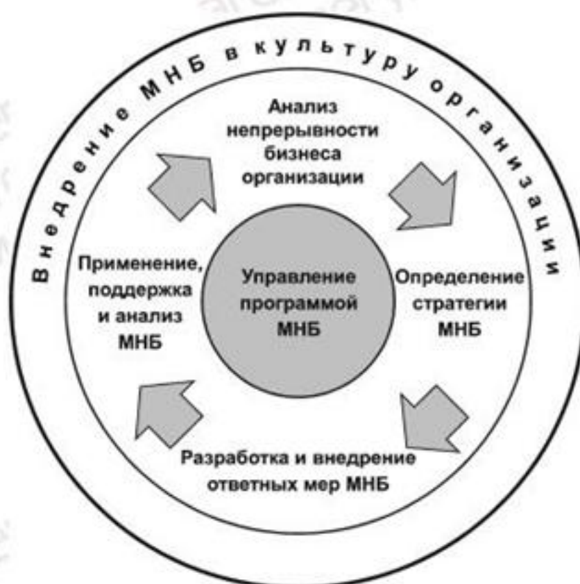
Рисунок 1 — Этапы жизненного цикла менеджмента непрерывности бизнеса

Жизненный цикл МНБ включает шесть элементов (см. рисунок 1). Элементы жизненного цикла могут быть внедрены организациями различных размеров и секторов экономики: государственными, частными, некоммерческими, образовательными, производственными и т.д. Область применения и структура программы МНБ могут быть различны. Затраченные на внедрение МНБ усилия зависят от индивидуальных потребностей организации, однако в любом случае эти шесть существенных элементов должны быть выполнены.