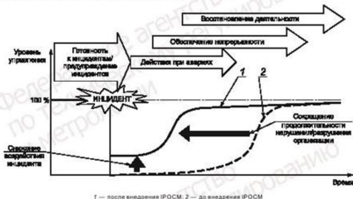
Рисунок 1 — Концепция готовности к инцидентам и IPOCM

Причастные стороны (заинтересованные стороны) требуют от организации быть заранее готовой к возможным инцидентам и нарушениям/разрушениям, чтобы не допустить приостановки критических видов деятельности, и, если произошла их полная остановка, быть способной быстро восстановить деятельность, поставку продукции и предоставление услуг (см. рисунок 1). Обеспечение готовности к инцидентам и непрерывности деятельности является процессом менеджмента, в рамках которого следует идентифицировать возможные негативные воздействия на организацию и создать структуру управления, направленную на минимизацию их воздействий.