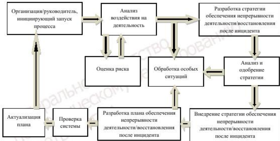
Рисунок 1 – Основные процессы обеспечения непрерывности деятельности / восстановления после инцидента