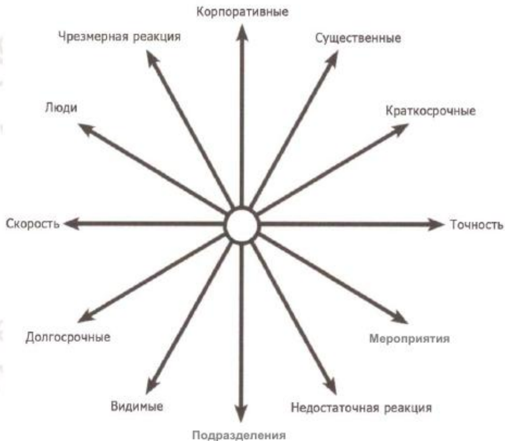
Рисунок 2 – Стратегические дилеммы в принятии решений

Некоторые возможные виды стратегических дилемм приведены на рисунке 2.