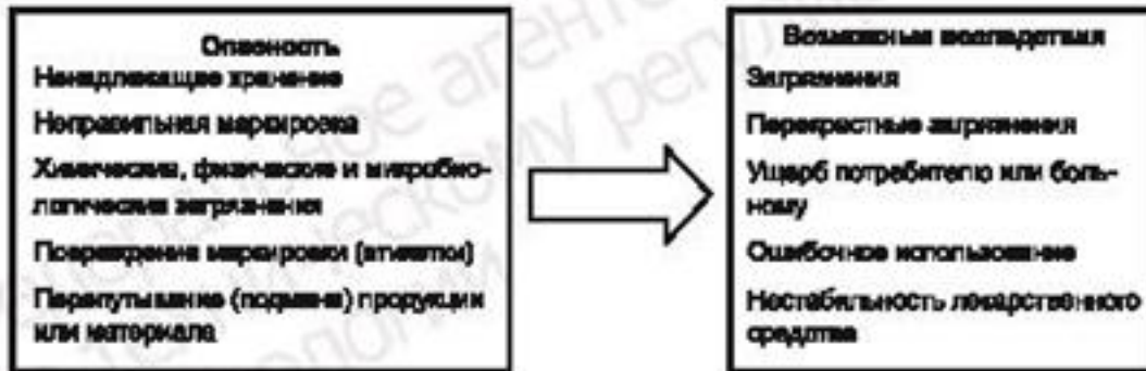
Рисунок С.2 — Примеры опасностей и возможных последствий

По каждому виду опасности, для которой не предусмотрены меры по ее предотвращению, следует оценить вероятность ее появления и возможные последствия (при участии заказчика, если требуется) (Рисунок С.2).