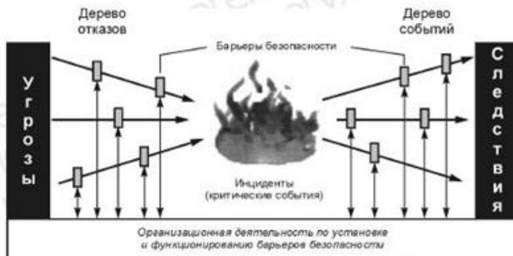
Рисунок 2 — Связь между технической и организационной безопасностью

Подход, используемый в данной методологии и комбинирующий дерево отказов и дерево событий, предполагает связь между технической и организационной безопасностью при оценке риска и представлен на рисунке 2. Схема этого подхода носит название «галстук-бабочка», хотя логичнее называть ее «песочные часы», что отражает суть методологии: если «песочные часы» установить «угрозами» вверх, то, во-первых, «движение песка» наглядно отразит динамику событий — от «причин» к «следствию» и, во-вторых, по количеству песка, достигающего дна, где расположены «следствия», можно судить о действенности функциональных и организационных барьеров. В дальнейшем для этой схемы возможно использовать оба эти названия.