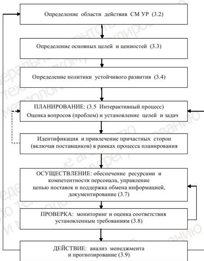
Рисунок 1 – Схема реализации настоящего стандарта