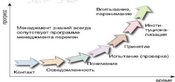
Рисунок 6 – Связь между менеджментом знаний и менеджментом изменения «Сканирование» знаний или аудит могут привести к лучшему пониманию завершенности организации и готовности ее персонала к МЗ.

Представляется также важным знать, где располагается организация на кривой изменения (см. рисунок 6), поскольку это дает представление о достигнутом прогрессе. Как правило, во-первых, на переход от контактной фазы до фазы принятия (в зависимости от характера и размера бизнеса) требуется один или два года. Во-вторых, стратегия, предусматриваемая проектом по МЗ, должна адаптироваться к положению на кривой изменения: слишком часто организации начинают крупномасштабные проекты или проекты, требующие крупных бюджетов, без наличия необходимых инструментов, а иногда даже без обеспечения осведомленности или понимания людьми, которые должны работать по-иному или применять новые инструменты.