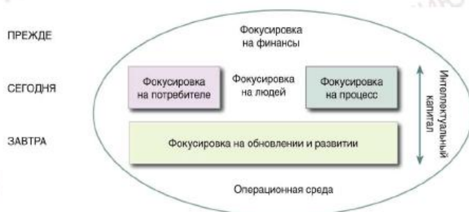
Рисунок 4 – Навигатор Скандиа

Фокусировка на сотрудников является основой организации и имеет большое значение для организации, создающей стоимость. Процесс создания знаний представляется воображаемым именно в этой фокус-области. Представляется также важным удовлетворенность сотрудников своей рабочей ситуацией; удовлетворение сотрудников приводит к удовлетворению потребителей, повышая объем продаж организации и улучшая результаты.