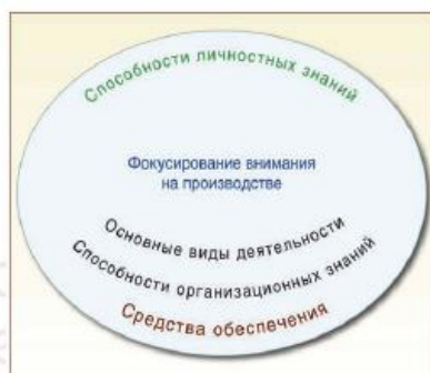
Рисунок 1 – Основа менеджмента знаний: европейская перспектива

Эти виды деятельности реализуются, как правило, в поддержку более широких производственных процессов. Их интеграция и результативность в рамках организации должны поддерживаться необходимыми методами и инструментами МЗ.