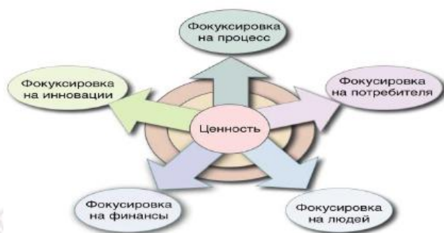
Рисунок 2 – Пять измерений, обеспечивающих добавления ценности в результате применения менеджмента знаний

Пять измерений, упомянутых выше, непосредственно относятся к интеллектуальному капиталу (ИК). ИК может включать знания сотрудников, данные и информацию по процессам, экспертам, продукции, потребителям и конкурентам и интеллектуальную собственность, например, патенты или регулирующие лицензии. ИК включает понимание, интуицию и технологии, обеспечивающие в результате инновации, новые разработки и рост благосостояния организации. Знания, которыми владеет организация, могут превращаться в материальный актив специальной рыночной стоимости. Это нередко проявляется как разница между нетто-капиталом и рыночной стоимостью организаций, открытых для общественности.