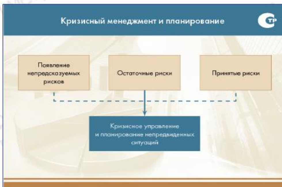
Рисунок 1 — Кризисный менеджмент и планирование

Цель кризисного управления состоит в том, чтобы подготовиться к кризисам так, чтобы наносимый ими ущерб был минимален. Много кризисных событий происходит одинаково и приводит к аналогичным последствиям независимо от того, вызваны ли они различными рисками. В случае если риск, который вызывает кризисные проявления, является вновь возникающим (как это часто бывает), а потому не зафиксированным на стадии идентификации, для такого риска может использоваться план действий для непредвиденных ситуаций.