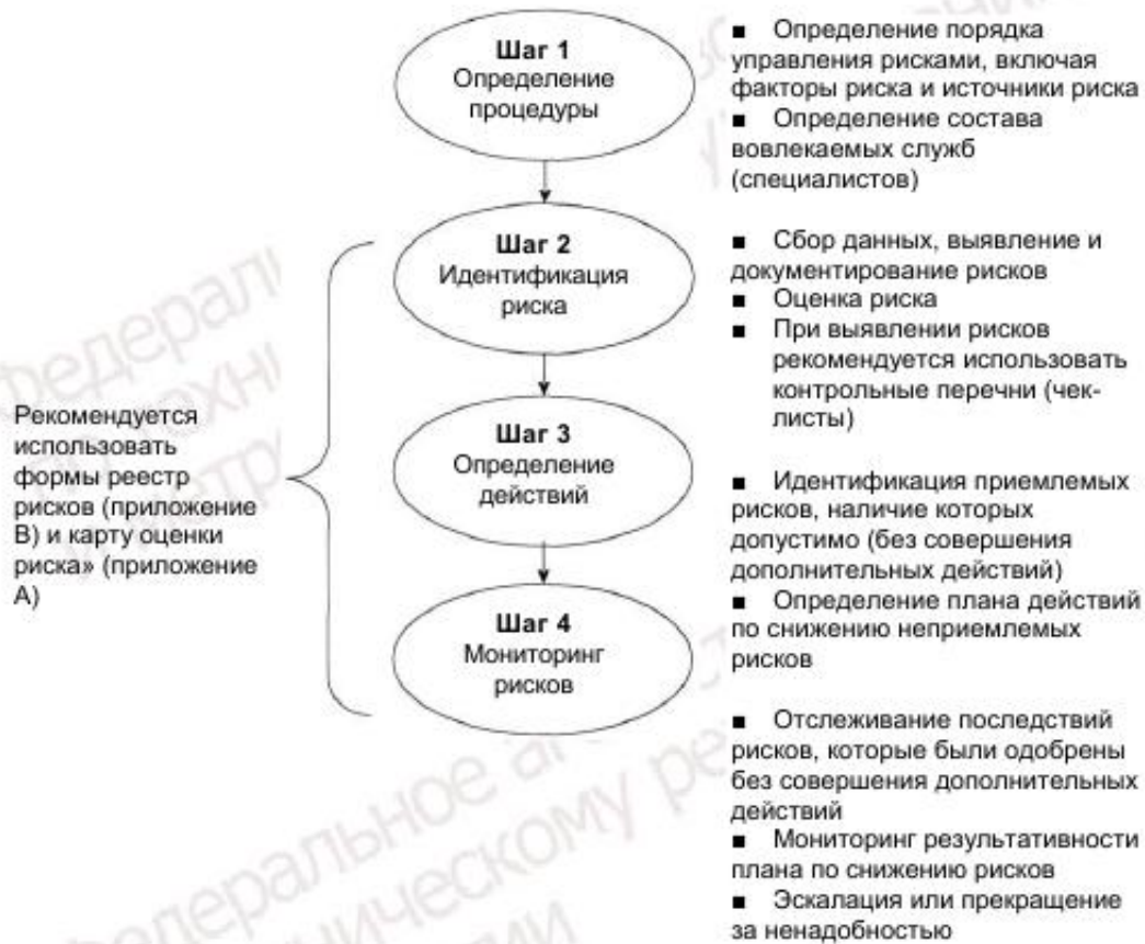
Рисунок 2 – Этапы управления риском

Этапы управления риском приведены на рисунке 2.