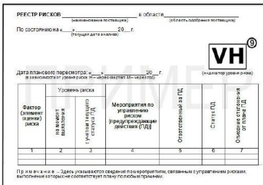
Рисунок Б.1 — Рекомендуемая форма реестра рисков

Также может быть использована форма, рекомендованная SAE ARP 9134 (таблица Б.2).