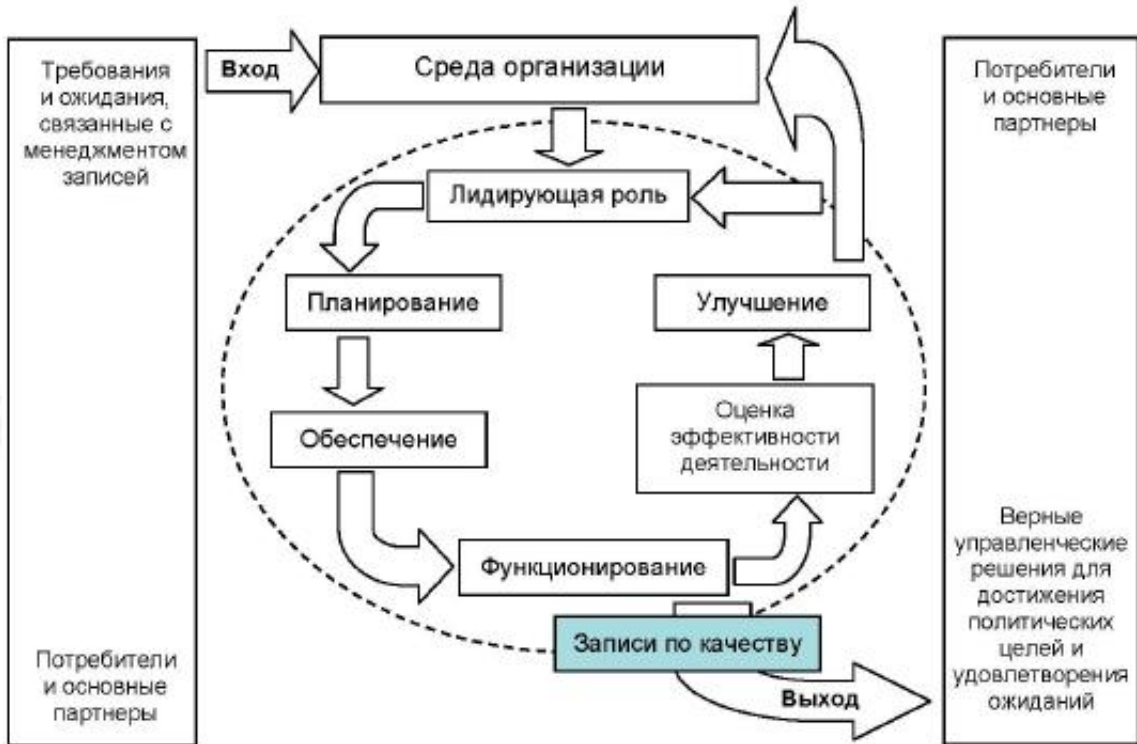
Рисунок 2 — Структура SM3