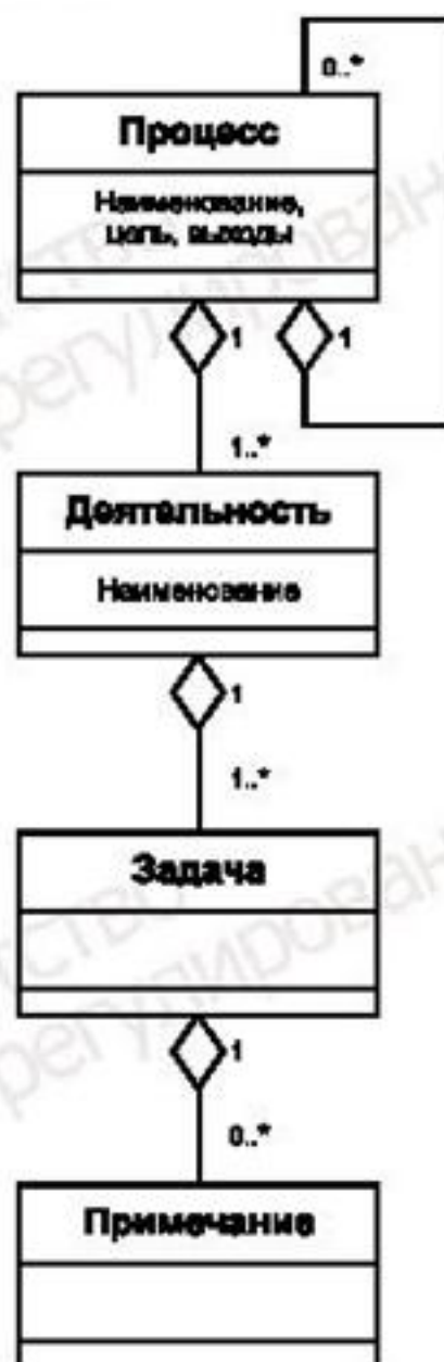
Рисунок С.1 — Конструкции процессов в ИСО/МЭК 12207 и ИСО/МЭК 15288

Примечания используются, если покажется необходимость в поясняющей информации для лучшего понимания содержания или структуры процессов. Примечания обеспечивают пояснение, относящееся к реализации или области применимости, такой как описание, примеры и другие представления.